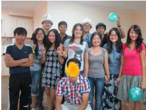
2012 年在教會的侍奉開始前去往中亞短宣

2012 年從北京的研究所畢業之時，我在百般糾結下終於確認了，要全時間侍奉主兩年。2012 年到 2014 年在城市家庭教會的服侍經歷是曠野尋求的日子，是靠主恩典走過的每一天，也是經歷神親自預備引導海外裝備之路的開始。