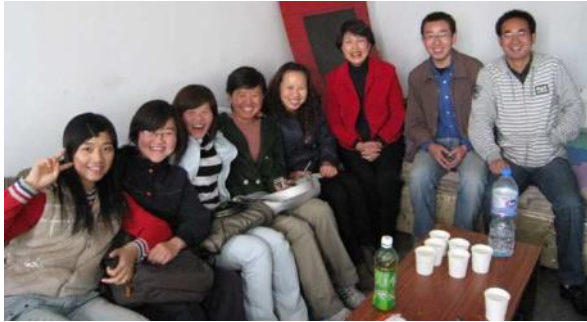
青澀的大學時光沐浴主恩

2006 年到 2010 年是我在中國西北一間民族大學就讀的四年，也是我遇見主、開始跟隨主的奇妙四年。宣教士的無條件的愛和生命的澆灌，是我生命養分的常汲之源。