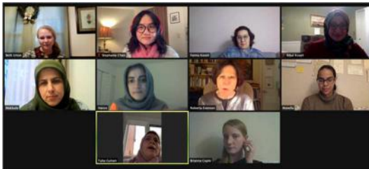
2020 年疫情期間在線上向本地宣教士學習服侍穆斯林朋友

在慕迪學習期間，我嘗試了本地跨文化宣教和海外的跨文化短宣來預備自己。在這個過程中，我深感個人生命在個人情緒情感成長上的不平衡；主耶穌也藉著一系列的危機提醒我的注意。於是在慕迪的學業結束之後，我等候尋求主是否為我開路，給我機會接受關於心靈關懷的裝備，並期待將來將心理諮詢的技能和主的國度事工相結合。